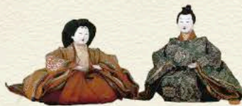
旧庄内藩主酒井家に伝わる雛人形 有職雛 酒井家蔵