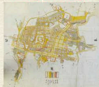
鶴ヶ岡城下絵図 明和年間 当館蔵