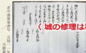
老中連判書書写 元禄二年 当館蔵