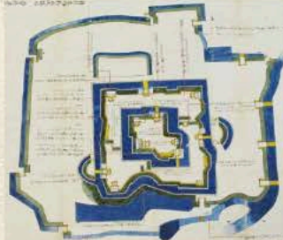
羽州庄内鶴岡城絵図(部分)明暦三年 当館蔵