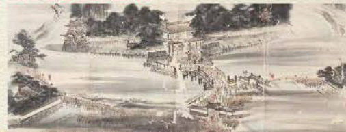
山形県指定有形文化財「大泉義経絵図三十四」 郡転領之所其共庄内御領地之命下り 奉行御着追手前前集図(部分)江戸時代後期 当館蔵

近辺の町人、村人数千人が早駕籠を追って大手門の前に群集した。藩士たちも知らせを聞くためになだれ込むように登城している。大手門や門前の橋、馬出、二の丸の角櫓、土塀や堀の様子なども立体的に知ることが出来る。