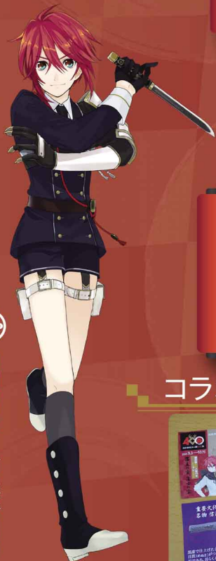
刀剣男士 信濃藤四郎

庄内神社様でも、恒例の応援企画として「記念御朱印 ～藤～」の頒布や、等身大パネルの再展示があります。 庄内神社公式ホームページ・Twitterをご覧ください！