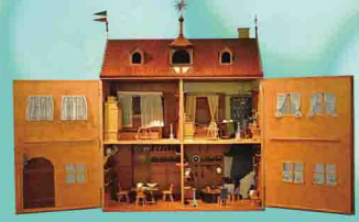
1673と記されたニュルンベルクの家(複製) 1982年制作