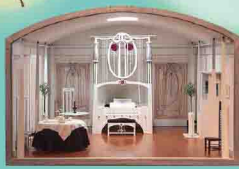
マッキントッシュ ミュージックルーム 2005年制作