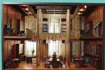
マッキントッシュ 図書資料閲覧室(部分) 2004年制作