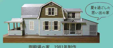
御殿場の家 1981年制作