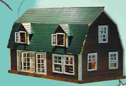
けいこの家 1974年制作