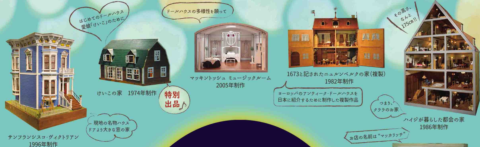
サンフランシスコ・ヴィクトリアン 1996年制作