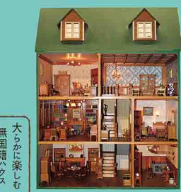
グリーンハウス「77」 1977年制作