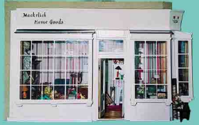
ホームグッズ・ショップ 2004年制作 花見郁代氏 トータルデザイン・装飾