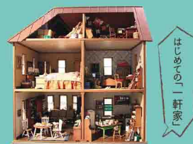
アメリカンハウス 1979年制作 市川たか氏 トータルデザイン・装飾