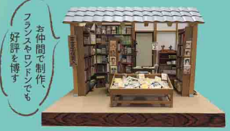
日本のお店「古書店」 1996年制作