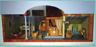
ドイツ中世の共同浴場 16世紀の お風呂文化 1986年制作