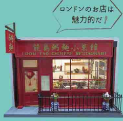
ロンドンのお店シリーズ「中華料理店」 1996年制作