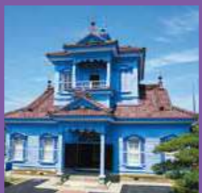
重要文化財 旧鶴岡警察署庁舎