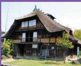
重要文化財 旧沢谷家住宅