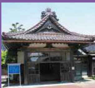
旧庄内藩主 御隠殿