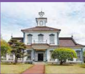
重要文化財 旧西田川郡役所