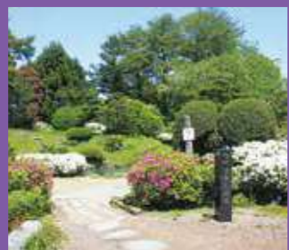
国指定名勝 酒井氏庭園