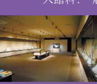
美術展覧会場 （企画展会場）