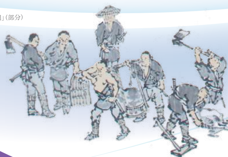
石川淡雲画、成澤高景賛「松ヶ岡開墾園」（部分） （松ヶ岡開墾場所蔵）

刀を鎌に持ち替えた 報国の精神と絆 サムライゆかりのシルク 日本近代化の原風景に会うまち鶴岡へ