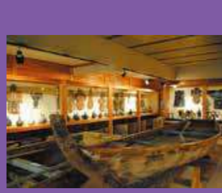
重要有形民俗文化財 収蔵庫