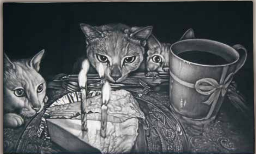
Anniversary II (2016年)